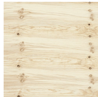
Contre face III

Contre face non réparée, non poncée, admettant trous, nœuds et fentes.