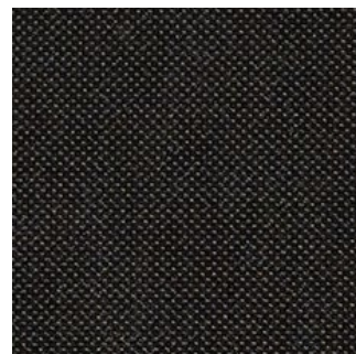
Contre face lisse

Contre face lisse, revêtue d'un film phénolique brun noir (400 g/m 2 ).